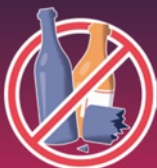
emballages en verre