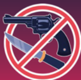
armes ou fac-similé