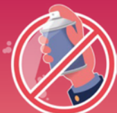
aérosols et lacrymogènes