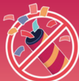
canons à confettis

En cas d'infraction constatée, une verbalisation sera appliquée pour non-respect de l'arrêté, suivie d'une exclusion du périmètre de l'individu verbalisé.