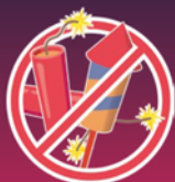
engins pyrotechniques ou feux d'artifice

Au sein du périmètre de la bande, interdiction absolue de détention de :