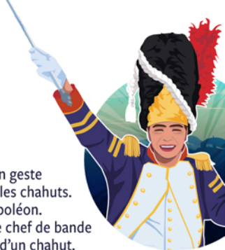
Figure emblématique, il mène la bande d'un geste autoritaire, guide la musique et déclenche les chahuts. Son costume parodie les grenadiers de Napoléon. Lorsque le tambour-major lève sa canne, le chef de bande est chargé d'entonner les premières notes d'un chahut. Il est suivi par le reste des musiciens.